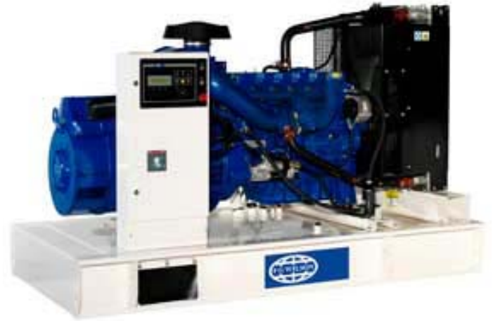
Immagine riportata a solo scopo illustrativo