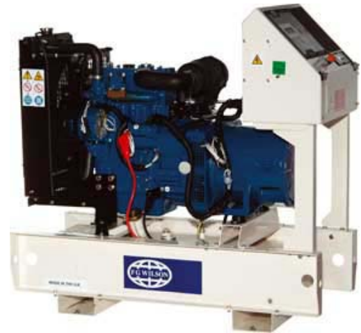
Immagine riportata a solo scopo illustrativo