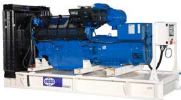
Immagine riportata a solo scopo illustrativo